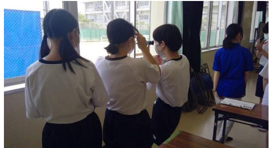
B：果樹について学ぼう