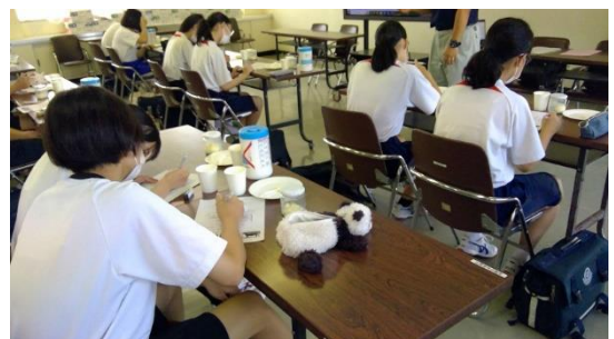
H：バターのおいしさ

午後の部が全て終了したところで、遠方からの参加で関心のある生徒さんを対象に、寄宿舎の説明会も行いました。