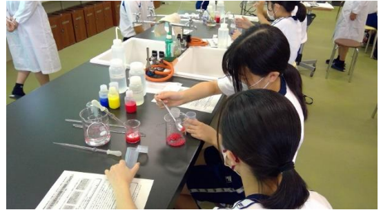
F：パンのふくらむ仕組み