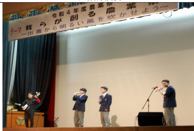
生徒実行委員会企画