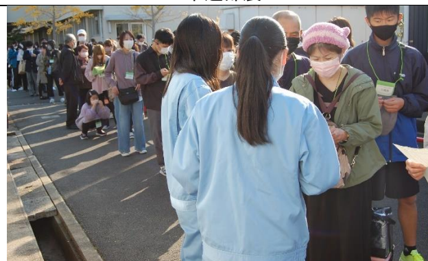
農産物・加工品即売