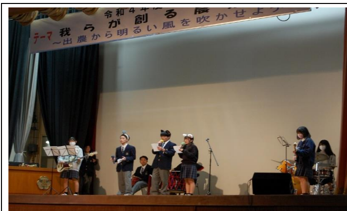
生徒実行委員会企画