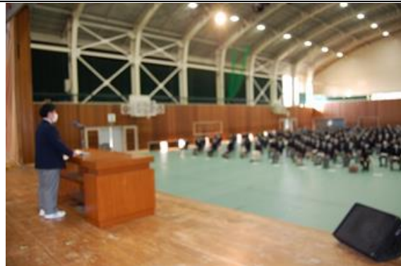
勇実行委員長挨拶