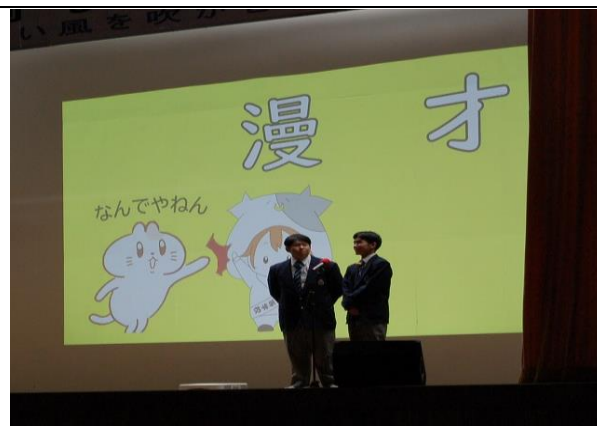
生徒実行委員会企画