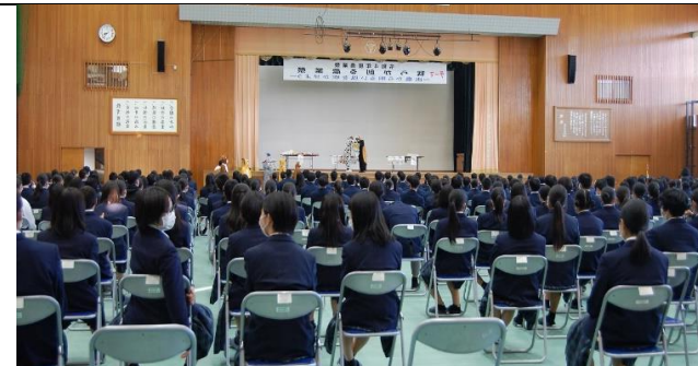
スタンプラリー抽選会

生徒たちが取り組む学習成果や活動の内容を展示したり即売したりすることで発表、発信することができました。そして、来場された方に、笑顔と適切な対応できる自己表現力の向上にも努め互いに高め合い、認め合うまたとない機会とすることができました。