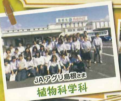
JAアグリ島根さま 植物科学科