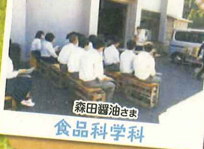
森田醤油さま 食品科学科