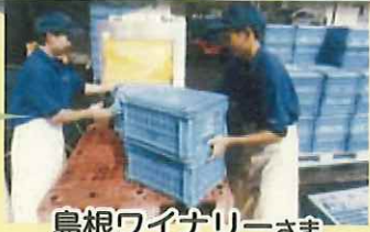
島根ワイナリーさま