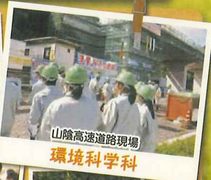
山陰高速道路現場 環境科学科