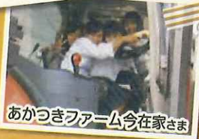
あかつきファーム今在家さま