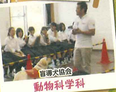
盲導犬協会 動物科学科