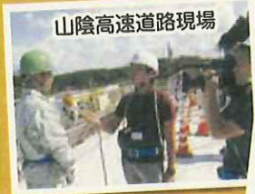
山陰高速道路現場