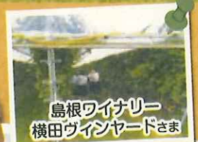
島根ワイナリー 横田ヴインヤードさま