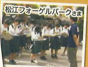
松江フォーゲルパークさま