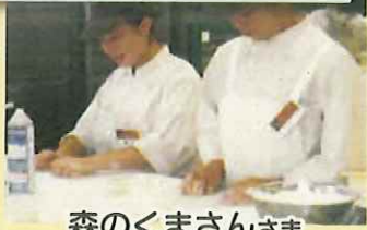
森のくまさんさま