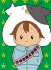
出雲農林高校 公式キャラクター モーリン