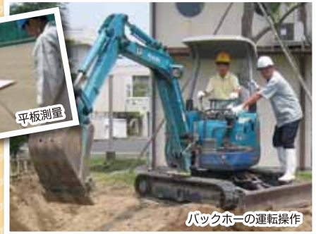
バックホーの運転操作