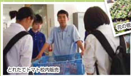
とれたてトマト校内販売