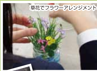
草花でフラワーアレンジメント