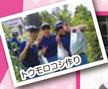
トラモロコシ作り