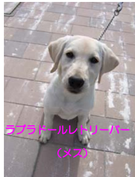
ラブドールレトリバー (メス)