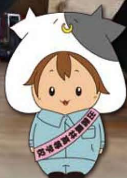
出雲農林高校 イメージキャラクター モーリン