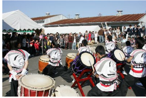
(出農太鼓の大演奏)