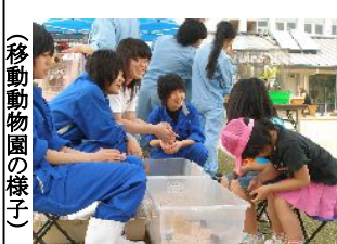
(移動動物園の様子)

全校生徒で行うプロジェクト発表会を行う予定です。三年間の集大成を発表すべく、生徒は着々と準備を進めています。 日時・平成二十二年一月十六日(金) 場所・出雲市民会館