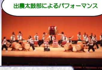
出農太鼓部によるパフォーマンス