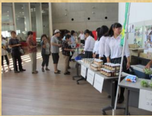
高校生の文化発信ステージ(うらら館)での販売