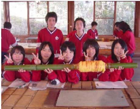
宿泊研修二日目 科別研修食品科学科 バウムクーハンの作り

しかし、サンレイクでの宿泊研修に参加することで、同じクラスの人と友達になって少しわかった気がします。また、バウムクーハンの作りでは食品科学科の授業に少し触れることができました。これからの三年間をクラスのみんなと楽しく、そしてともに成長していけたらいいと思っています。