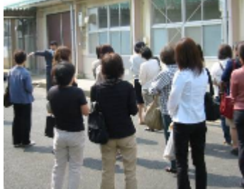
昨年の学校見学ツアーの様子

新しい年度がスタートし、生徒、教職員共に清新な気持ちで学校生活をおくっています。PTAでは先の日程で総会を開催します。今年度の本校の教育活動を理解していただくために、必ず、参加していただきますようお願いいたします。詳細は同封の案内書をご覧ください。