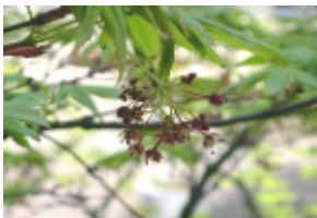
中庭に咲く もみじの花

四月号は、総会案内にあわせて各家庭に郵送させていただきます。次号からは、各担任より生徒を通じて配布いたしますのでご確認ください。