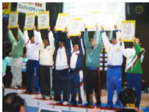
表彰式の様子(右から3人目が妹尾君)